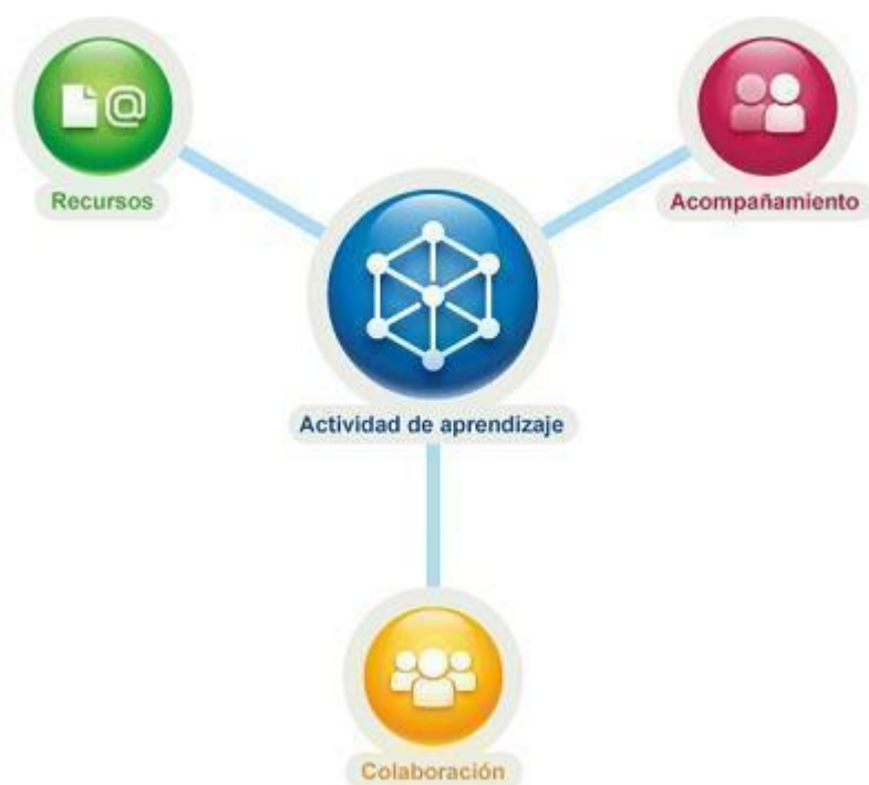
Representación de la concepción de actividad de aprendizaje en el modelo educativo UOC.

Los procesos de enseñanza y aprendizaje que se llevan a cabo en el aula virtual, se caracterizan por un diseño formativo basado en el desarrollo de actividades de aprendizaje y evaluación. Estos procesos se caracterizan por la asincronía en su mayoría de procesos y la no coincidencia de los agentes que participan de la actividad educativa en un mismo espacio físico. Estas condiciones exigen un diseño formativo basado en actividades, de diferentes tipos y con objetivos concretos, que se van desarrollando de forma continua durante el semestre. Por ello, en este apartado se explica qué tipo de actividades conforman la propuesta formativa del Máster. Las actividades formativas han sido diseñadas para poder conseguir los resultados de aprendizaje planificados en cada módulo de contenidos. Se trata de actividades que inciden en su gran mayoría en la